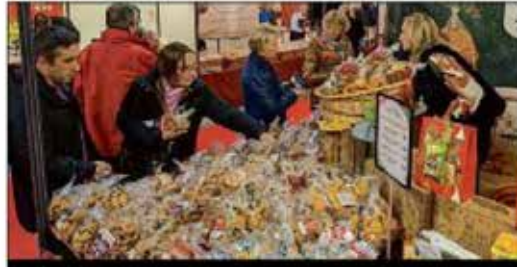
GOÛTEUX. Piébisclités, les biscuits artisanaux des Saveurs des Marais.

Celles et ceux qui s'adonnent au(x) chocolat(s) avaient reflué sur la mezzanine, où c'était déjà l'abondance « en vue des Fêtes ». Pour des plaisirs plus... rustiques, disons, on se mettait en quête d'un coup à boire avec un truc à grignoter.