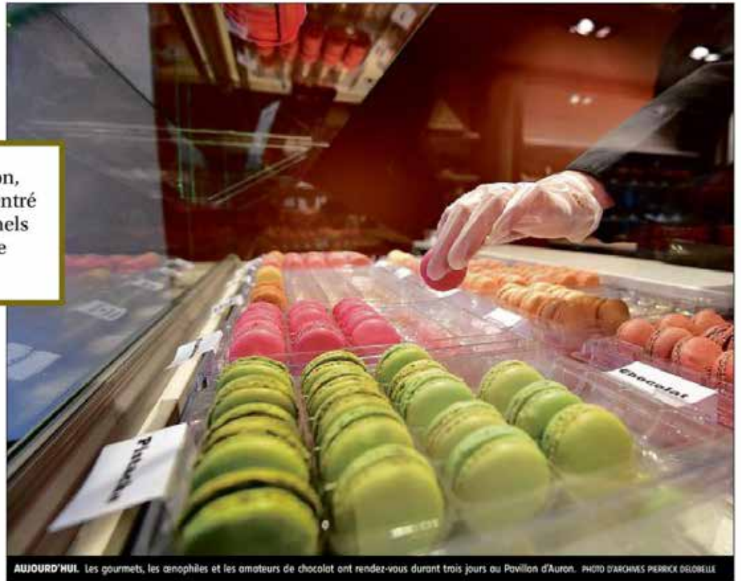
AUJOURD'HUI. Les gourmets, les anophiles et les amateurs de chocolat ont rendez-vous durant trois jours au Pavillon d'Auron.

Annulé l'an passé en raison de travaux, le Salon vins et gastronomie de Bourges revient en pleine forme, à partir d'aujourd'hui, avec 120 exposants, des animations et des conférences.